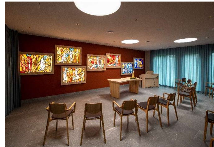
Raum der Stille