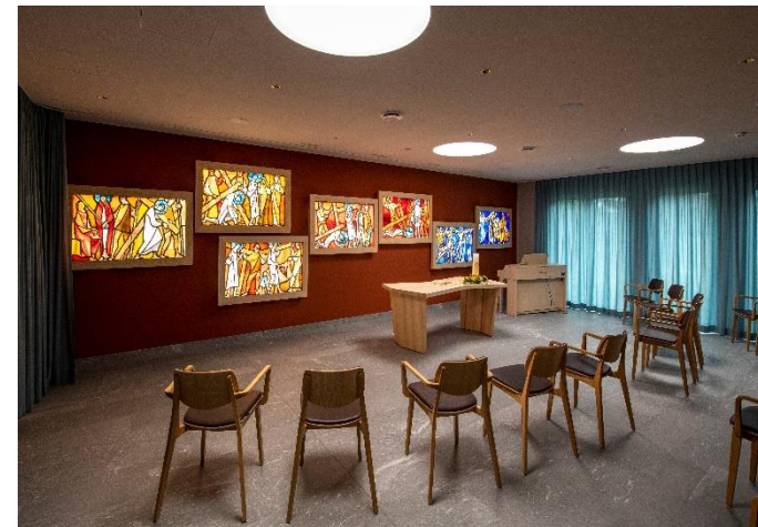
Raum der Stille