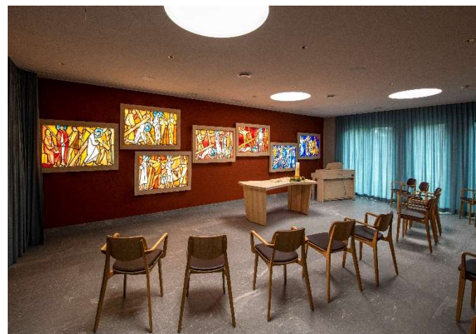
Raum der Stille