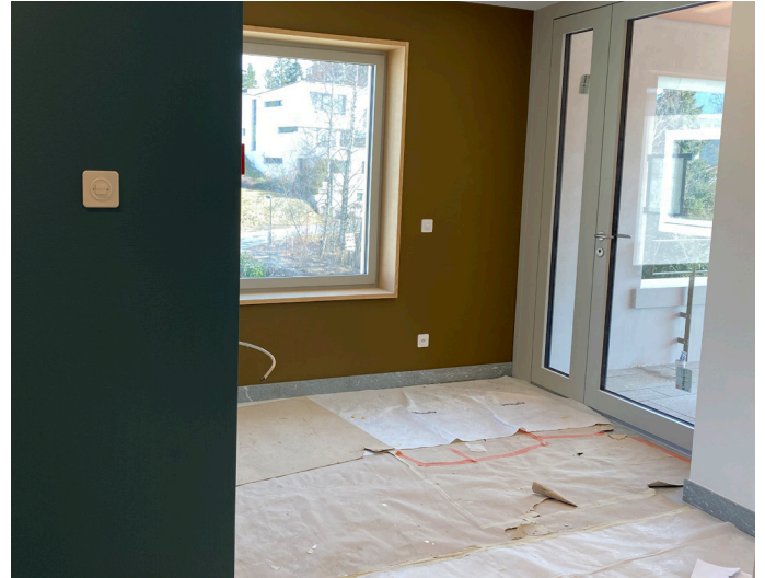
Ausgang zur Terrasse auf der Etage