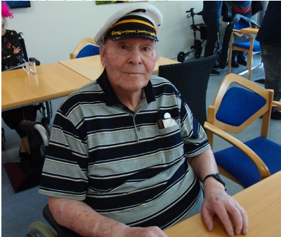
Fasnacht Februar 2020

Das Jahr 2020 gab wenig an Anlässen her. Dennoch haben wir Besuche von verschiedensten Darbietern erhalten. Hier ein paar Schnappschüsse aus dem Corona-Jahr 2020