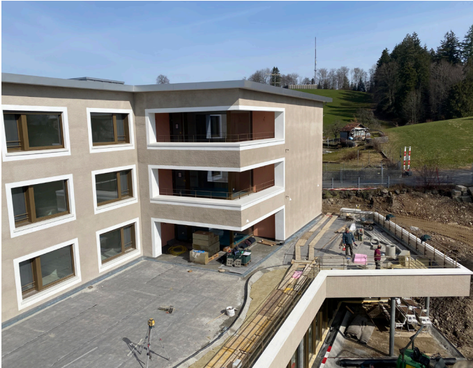
Aussenbereich mit Demenzgarten