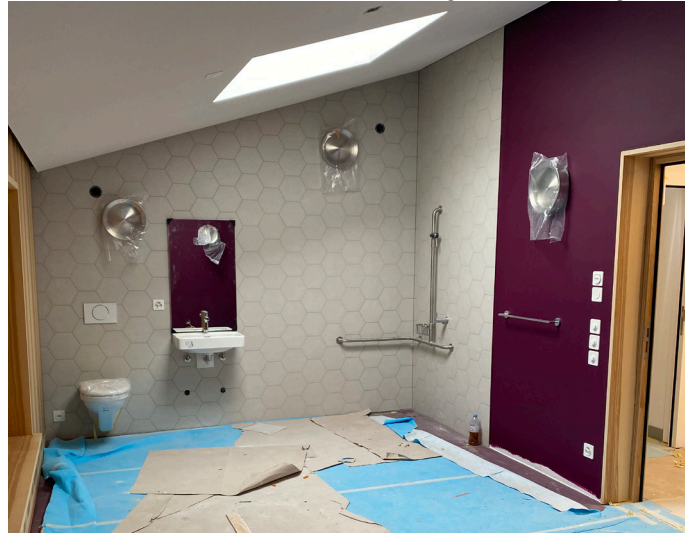
Dachgeschoss – Pflegebad